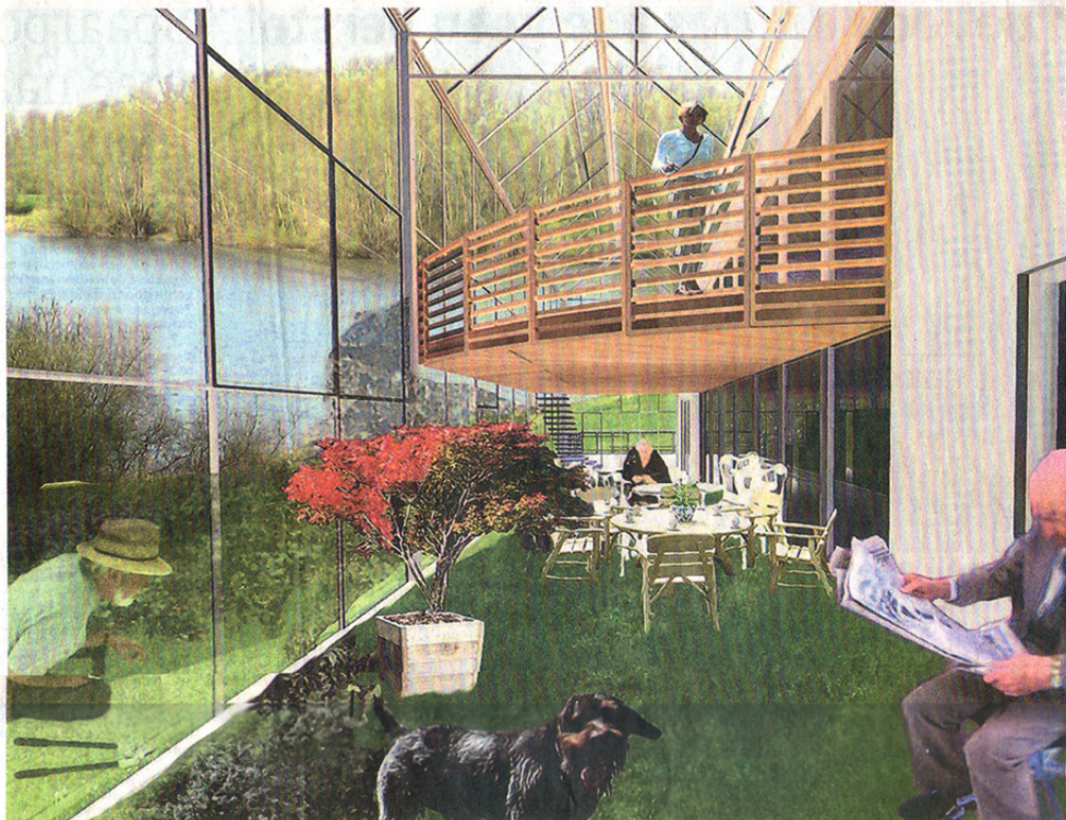
Fotomontage van de 'derde ruimte' in een Vier Seizoenen Woning voor senioren.

Foto: Brigitte van Bakel/Isis Architectuur