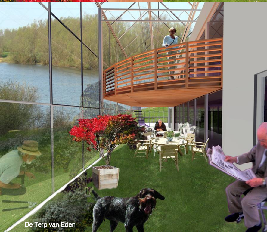
De Terp van Eden