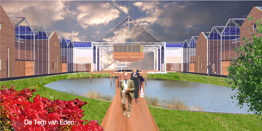
De Terp van Eden