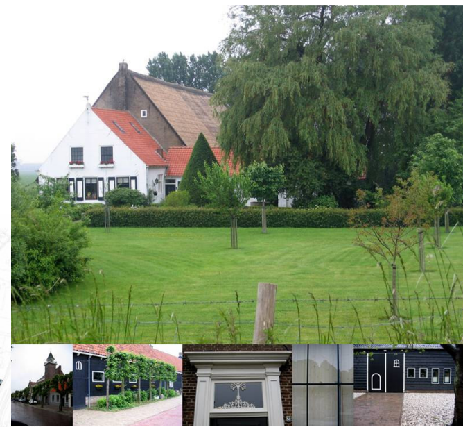
Referenties Zuid Beveland

Stedenbouwkundig: Het ruimtelijke programma is dusdanig georganiseerd dat de woningen geschakeld, gespiegeld en een kwart slag gedraaid kunnen worden. In het stedenbouwkundige plan biedt dit een veelzijdige oriëntatiemogelijkheid en een varieerd straatbeeld.