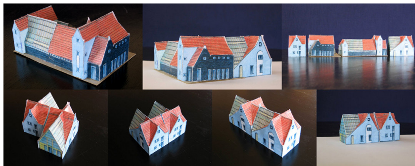
Varianten van twee woningtypen: Dag en Nachtwoning Langhuis

De opgave: In het plangebied Aria Goes ontwikkelt ABC Vastgoed Goes ca. 390 woningen. Isis Architectuur is uitgenodigd op Zeeuwse leest geschoede woningontwerpen te maken: 15 vrijstaande en/of geschakelde woningen in de eerste fase.