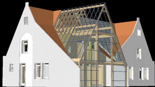
Modelstudie Dag en Nachtwoning