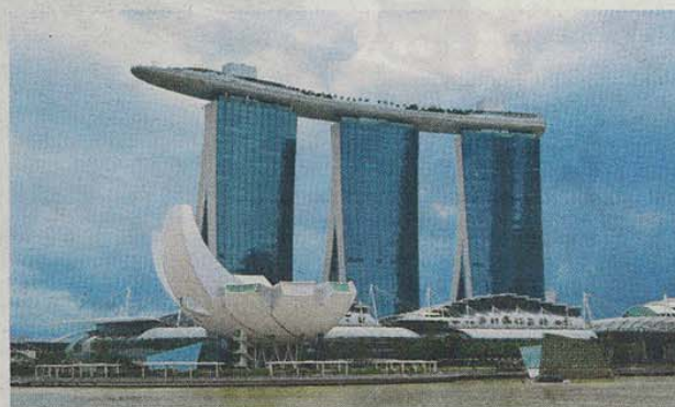
• Het spectaculaire gebouw van het festival in Singapore.

Bamboe is overigens feitelijk geen boom, maar een grassoort